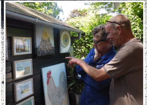
Fotoverslag OpenTuinKunst - pagina 11 Théa's Tuin WWWeetjes - pagina 16