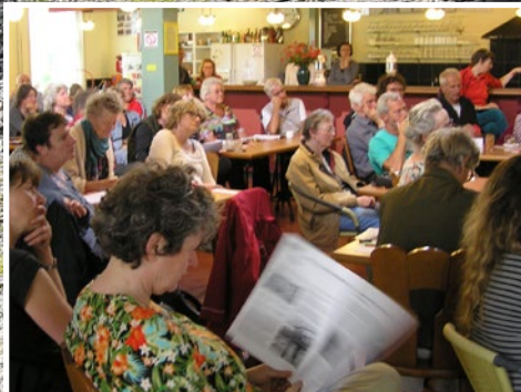
Verslag voorjaarsvergadering - pagina 6 Ratten in de tuin - pagina 13