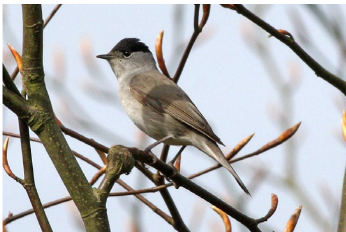
De zwartkop ( Sylvia atricapilla )