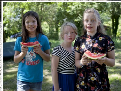
Kinderen actief! - pagina 9 Sproeien of watergeven - pagina 15